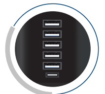
5 cargadores USB TIPO-A y 1 cargador USB Tipo-C